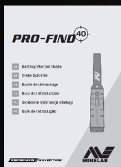
多言語対応 使用方法